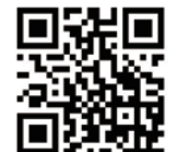
QRからも注文できます